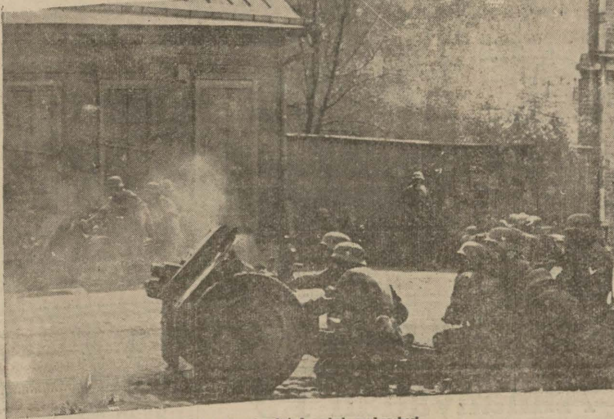
Bir Sovyet gehrinde sokak muharebesi

Dün gece saat biri beş geçe şehri- mizde şiddetli bir hareket tarzı hisse- dümiz. Kandilli rasathanesinin de- kaydediği bu sarsıntının merkezi he- nüz anlaşılammıştır.