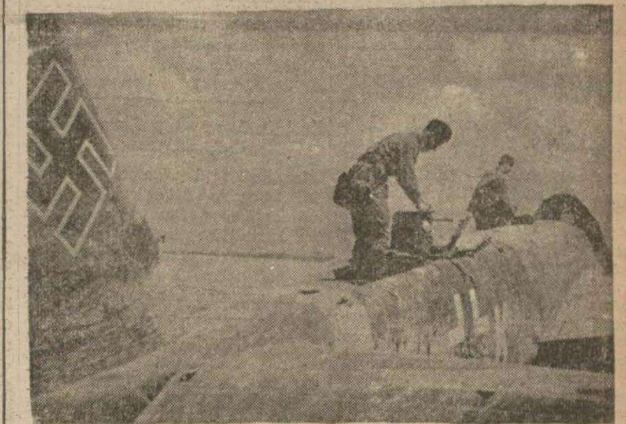
Sovyet topraklarında düşürülen bir Alman tayyaresi

Yakında garb cephesinde de çok şiddetli hava muharebeleri beklemeye lâzımdır Yazan : Mitat Tuncel